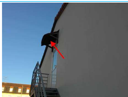
Matériaux : ZPSO-003 Prélèvement : P004 Description : Bardeaux bitumineux (« shingles ») Localisation : Bat 54 - Facade Résultat : Absence d'amiante