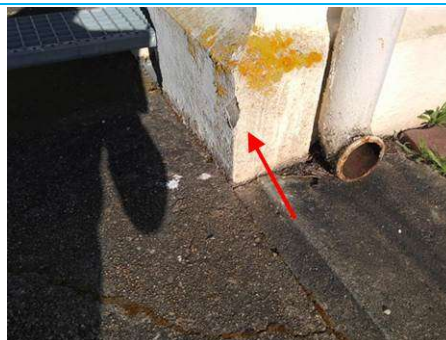
Matériaux : ZPSO-002 Prélèvement : P002 Description : Enduit extérieur soubassement Localisation : Bat 54 - Facade Résultat : Absence d'amiante