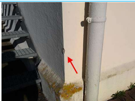
Matériaux : ZPSO-001 Prélèvement : P001 Description : Enduit extérieur Localisation : Bat 54 - Facade Résultat : Absence d'amiante