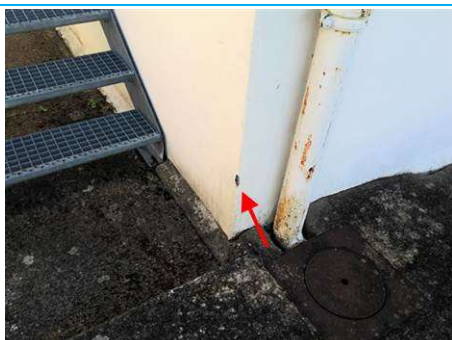
Matériaux : ZPSO-001 Prélèvement : P003 Description : Enduit extérieur Localisation : Bat 54 - Facade Résultat : Absence d'amiante